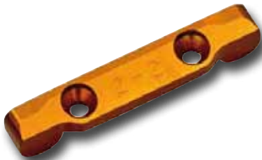
KYMDW102-22 SOPORTE SUSPENSION TRASERO ALUMINIO MA-10 DWS 2 - 2