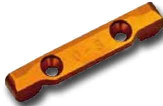
KYMDW102-03 SOPORTE SUSPENSION TRASERO ALUMINIO MA-10 DWS 0 - 3