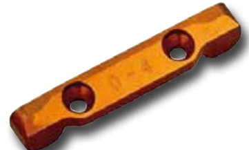
KYMDW102-04 SOPORTE SUSPENSION TRASERO ALUMINIO MA-10 DWS 0 - 4