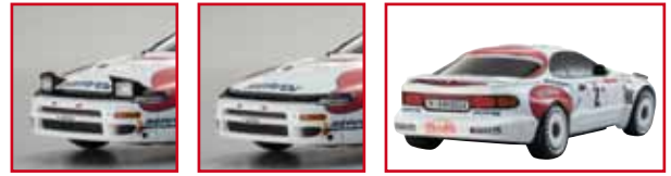
KY30582CS COCHE MA-10 TOYOTA CELICA'92 CARLOS SAINZ / LUIS MOYA