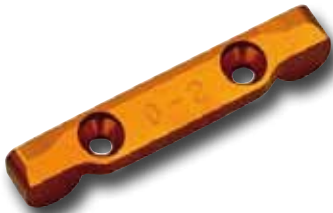
KYMDW102-02 SOPORTE SUSPENSION TRASERO ALUMINIO MA-10 DWS 0 - 2